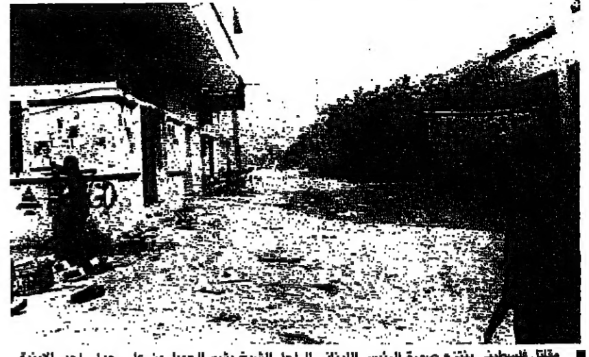
موقع حرق درب السيم في بلدة درب السيم (أ.ب.)